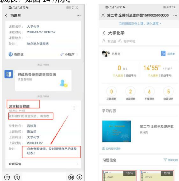
图 14 课堂报告

每次直播结束后每位同学都会收到雨课堂自动推送给大家的学习报告。错误习题、不懂课件、收藏课件、课程 PPT，雨课堂都帮各位同学整理好，关注每一节课的动态，助力你的改变和成长，如图 14 所示。