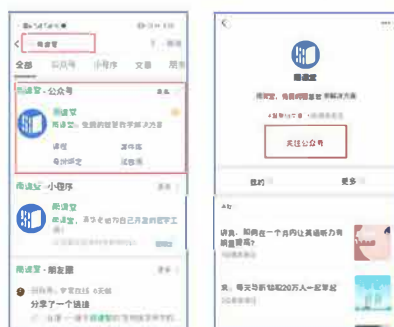
图 1 关注“雨课堂”