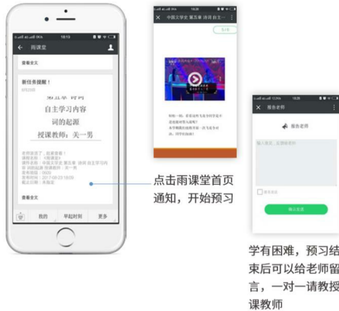
图 15 接收预习任务并完成预习

若老师给学生推送了预习资料，各位同学将在雨课堂公众号里收到相应的通知提醒，点击该提醒即可启动预习，预习之后带着思考去上课。（ 温馨提示：请在老师规定时间内完成预习。老师能看到你什么时候完成预习，预习了哪几页等信息 ）