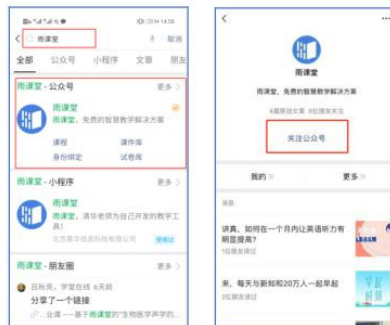
图 1 关注“雨课堂”