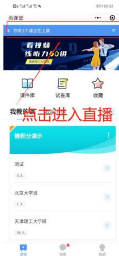
图 5 小程序进入直播界面

进入雨课堂小程序后，在小程序上方若发现有“你有 1 个课正在上课”的提示，点击该提示即可进入直播。如图 5 所示。