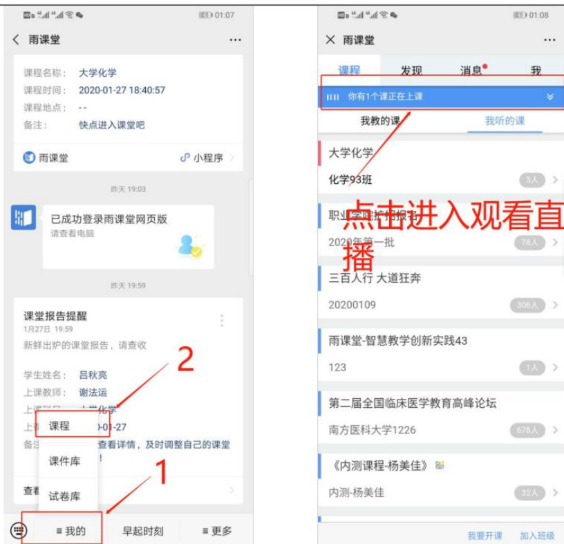
图 6 公众号进入直播

(4) 通过浏览器进入观看直播（推荐用 Chrome、火狐、360 浏览器等） 通过浏览器进入雨课堂网页版（ http://yuketang.cn ），点击右上角【登录网页版】， 如图 7 所示。之后用绑定了账号的微信扫码进入课程观看页面。