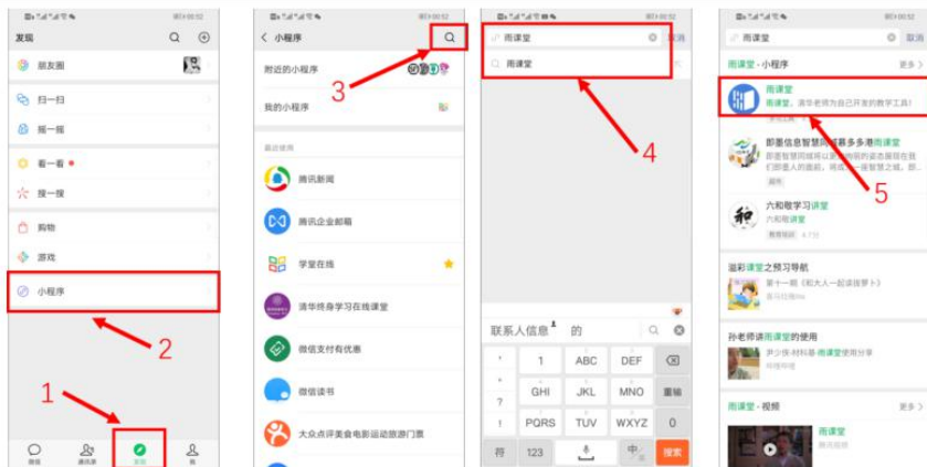
图 4 搜索进入雨课堂小程序

进入雨课堂小程序后，在小程序上方若发现有“你有 1 个课正在上课”的提示，点击该提示即可进入直播。如图 5 所示。