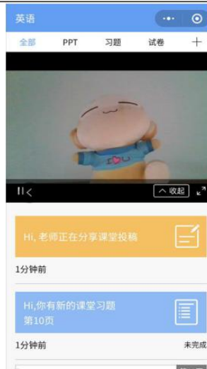
图 9 学生手机端直播预览效果