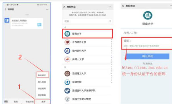
图 2 身份绑定