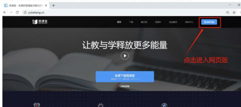
图 7 雨课堂网页版登录界面

(4) 通过浏览器进入观看直播（推荐用 Chrome、火狐、360 浏览器等） 通过浏览器进入雨课堂网页版（ http://yuketang.cn ），点击右上角【登录网页版】， 如图 7 所示。之后用绑定了账号的微信扫码进入课程观看页面。