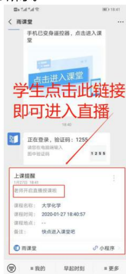
图 3 学生接收上课直播提醒

(1) 教师可在开启直播时给学生发送通知，学生可在微信公众号里收到直播提醒，点击此消息即可进入直播。如图 3 所示。