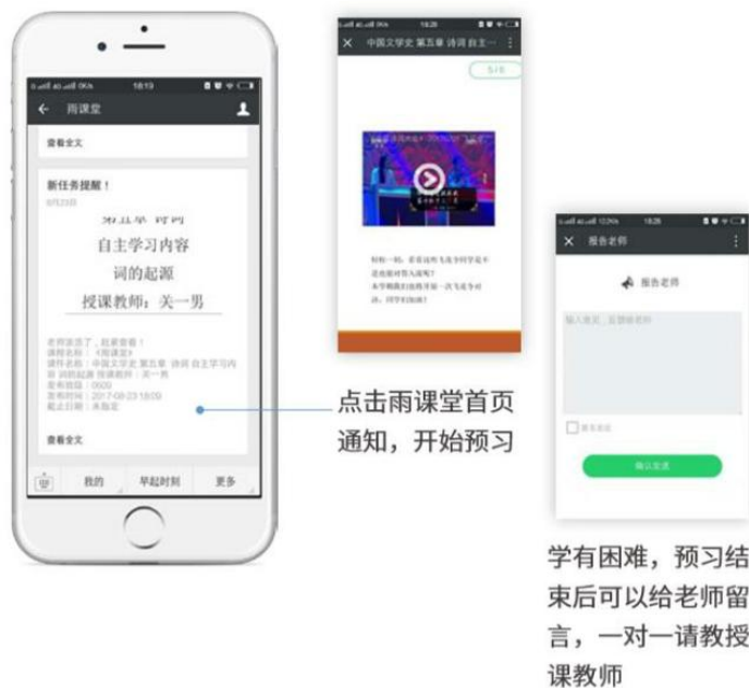
图 15 接收预习任务并完成预习

若老师给学生推送了预习资料，各位同学将在雨课堂公众号里收到相应的通知提醒，点击该提醒即可启动预习，预习之后带着思考去上课。（ 温馨提示：请在老师规定时间内完成预习。老师能看到你什么时候完成预习，预习了哪几页等信息 ）