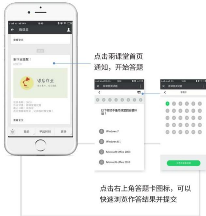
图 16 作业提醒