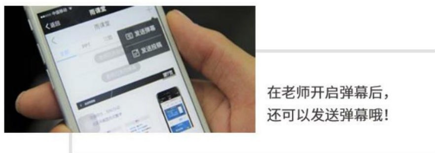
图 13 弹幕投稿操作

点击手机屏幕右上角的【+】，选择【发送投稿】，就可以随时发送图文消息给老师，如图 13 所示。