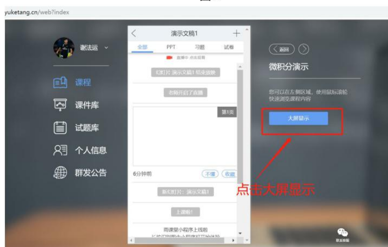
图 9 可进入大屏显示